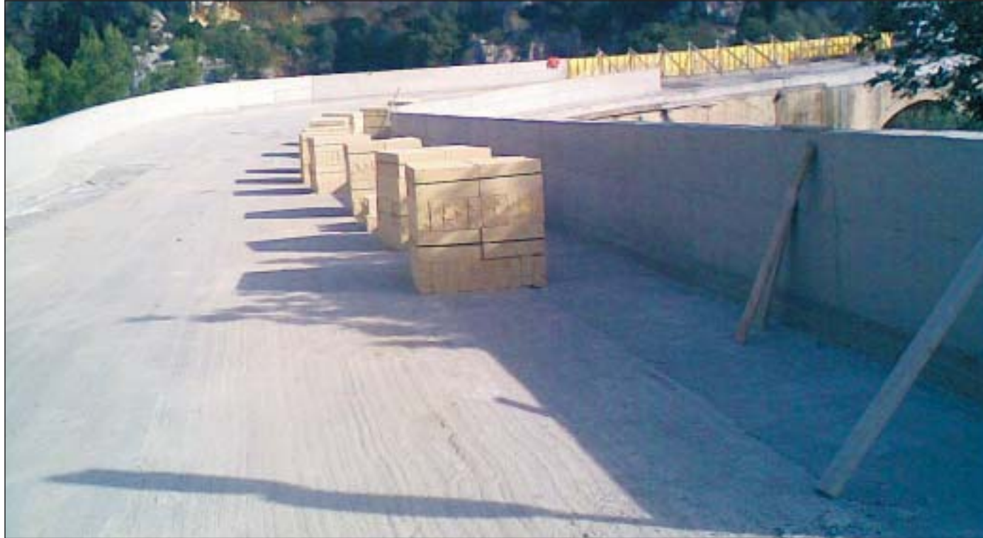
IL PONTE Sopra i parapetti in cemento e i tuffi che li ricopriranno e la curva allargata. Sotto una panoramica del ponte e le immagini dei due incidenti più spettacolari, ma senza vittime

E apre l'archivio fotografico del "iPhone". Nel fare il trasferimento delle foto sul cellulare del "Corriere", il castellanetano over mezz'età racconta di getto: I pilastri del ponte, per chi non sa che sono del 1800, 1836 per la precisione, paiono opera romana. Del resto la tecnica quella è. I vecchi parapetti abbattuti più dall'incuria che dai camion guidati da autisti assonnati erano in tema, omogenei ai poderosi e altissimi pilastri infossati nella gravina. Adesso, come vede non si è in lavoro di ristrutturazione,